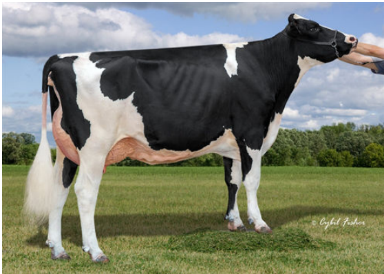
AOT POSITIVE HALLMARK DAM