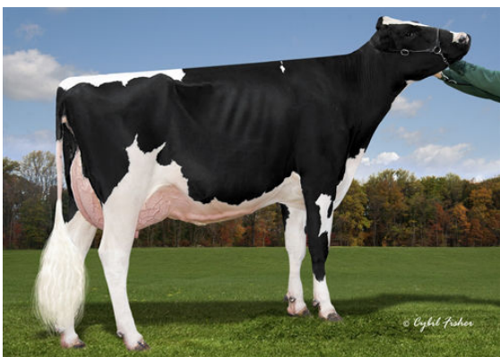
COOKIECUTTER DTA HABITAN GRANDDAM