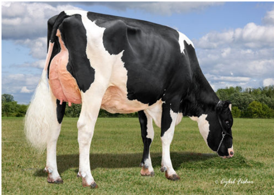
AOT POSITIVE HALLMARK DAM